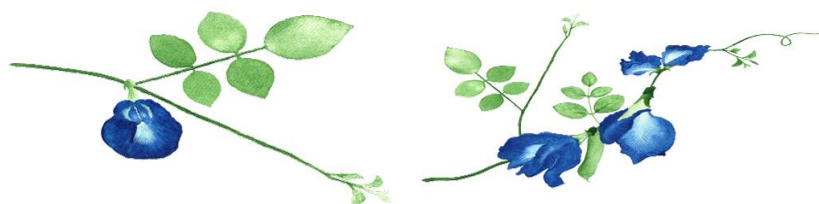
ภาพที่ 1 ผลงานการวาดดอกอัญชันของผู้เรียน